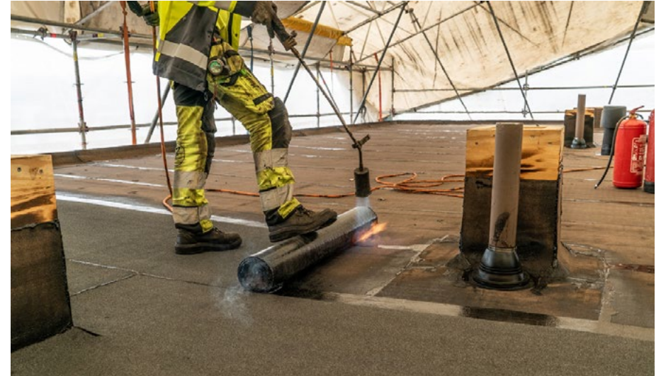
■ Kuva 15. Kattotulityö.

Huomioi, että kaikki vakuutusyhtiöt eivät tunnista vähäisen palovaaran työtä. Tämä tarkoittaa sitä, että näiden vakuutusten piirissä kaikki työt, joissa käsitellään tulta tai lämpöä, luokitellaan tulitöiksi. Asian voi tarkastaa oman vakuutusyhtiön turvallisuus- tai suojeluohjeesta.