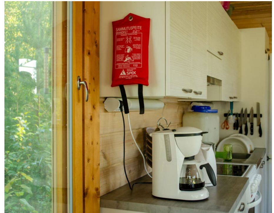
■ Kuva 2. Sammutuspeite.

Sammutuspeite soveltuu hyvin keittiöihin, grilleihin ja kohteisiin, joissa käsitellään pieniä määriä syttyviä tai palavia nesteitä. Sammutuspeite soveltuu myös ihmisen päällä olevien vaatteiden sammuttamiseen.