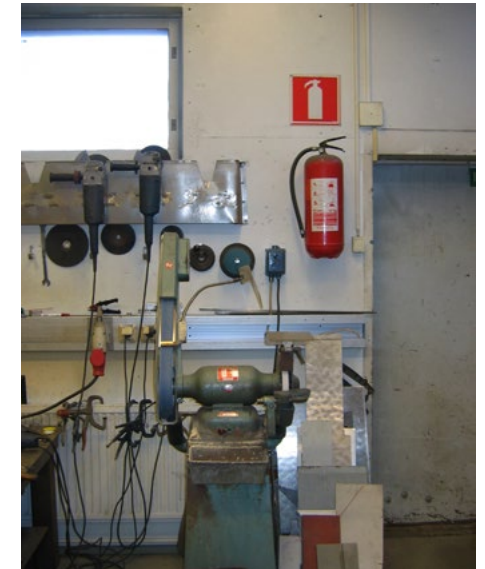
■ Kuva 17. Teknisen työn opetustila.

Oppilaitosten turvallisuusasioista neuvotaan esimerkiksi Suomen Palopäällystöliiton julkaisuissa "Oppilaitoksen turvallisuusopas" ja "Oppilaitoksen turvallisuusopas 2" sekä jatkuvasti päivittyvällä sivustolla: Käsityön oppimis- ja työympäristön suunnitteluopas .