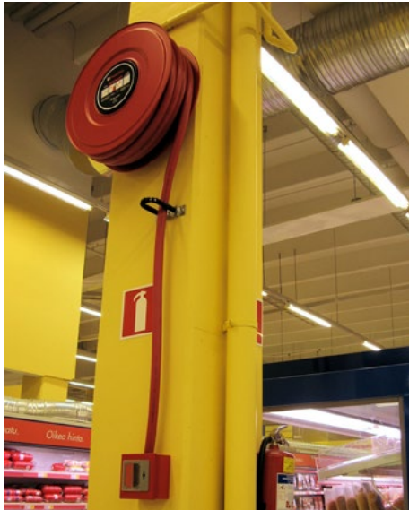
■ Kuva 16. Myymälän pikapaloposti.

Ravintoloihin sekä hotellien ja muiden majoitusliikkeiden käytävillä soveltuvat 13A 144B -teholuokan käsiammuttimet 200–300 m 2 :ä kohden. Etäisyys lähimmälle sammuttimelle ei tulisi olla 25–30 metriä pidempi. Ammattimaisessa keittiössä tulisi olla vähintään yksi 13A 144B -teholuokan käsiammutin ja sammutuspeite.