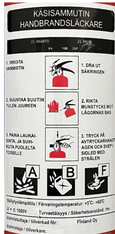
■ Kuva 7. Käyttöetiketti.