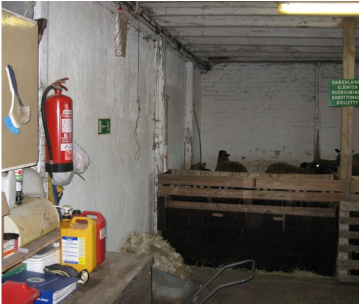
■ Kuva 12. Eläinsuoja.