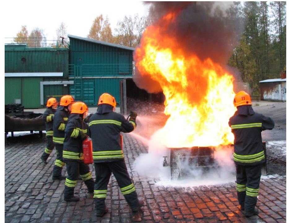
■ Kuva 20. Palon sammuttaminen ryhmässä.

Jos tuli on jo ehtinyt leviää huoneistoon, on muistettava sulkea poistuttaessa ovet; näin hidastetaan palon leviämistä.