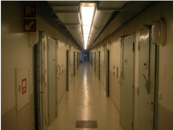
■ Kuva 18. Vankilan sellikäytävä.

Alkusammuttimiksi soveltuvat esimerkiksi 27A 144BC teholuokan käsisammuttimet. Näitä voidaan sijoittaa 1–2 kpl jokaiseen palo-osastoon esimerkiksi selliosaston vartiohuoneeseen, keittiöön, tuotantotiloihin, varastoihin, palovaarallisen toiminnan lähettyville jne.